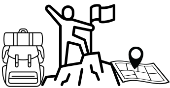
系列一：學校自主戶外教育營