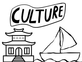
系列二：島嶼文化民生古蹟歷史