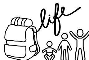
系列三：成長生活自理